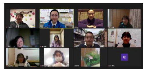
赤い羽根ボランティアスクール 完全オンラインで研修会を実施