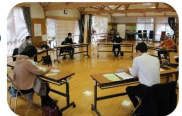
かみじまネット推進会議の様子