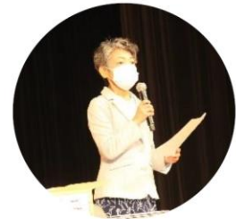
まちづくりのつどいにおいて権利擁護をテーマに講演会を実施