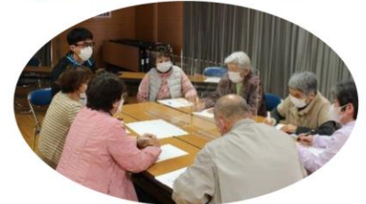
介護支援ボランティア研修会の様子