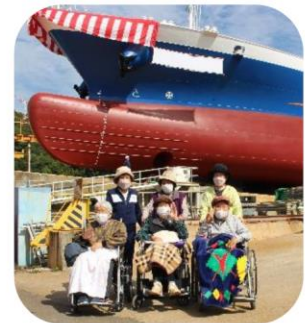
夢ハウス事業において進水式の見学に行きました！