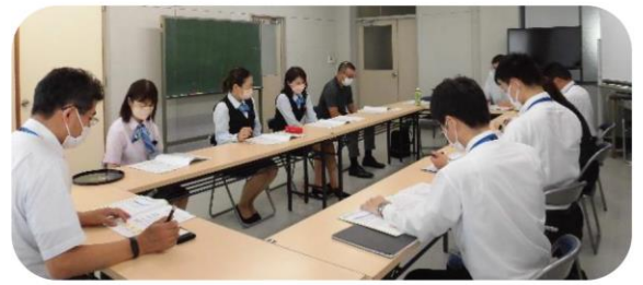
地域包括支援センターの職員が企業に対して認知症サポーター養成講座の実施