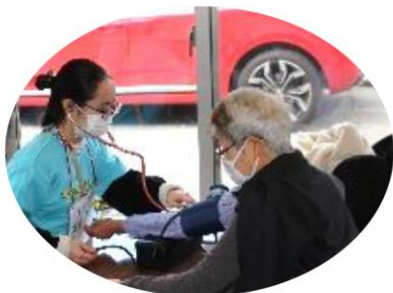
健康チェックを行いました