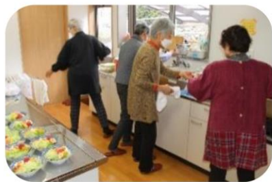
久々の会食ではりきっておもてなし