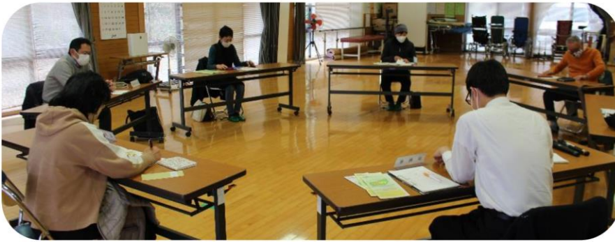
推進委員会の様子

本会としては、支援を必要としている人と、活動したい人がつながるサービスにしているために、推進委員会で今後の活動や広報、研修会など、今まで以上に協議し工夫してまいります。