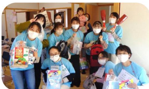
ビンゴゲームで沢山景品をもらいました