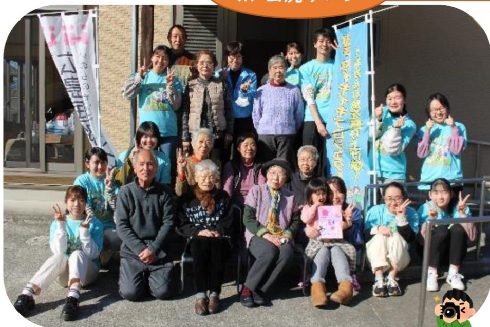
最後はみんなで記念撮影📷