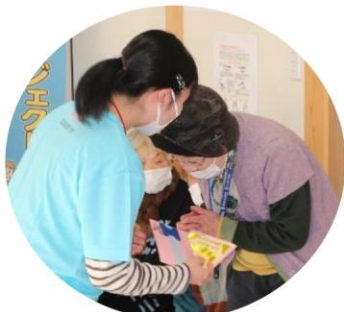
学生がひとりひとりにメッセージカードを送りました

今回は「便秘の予防」についての健康教育で、便秘の原因や予防のための食生活について学び、腸の運動として効果のある「の」の字マッサージをみんなで行いました。また、学生考案の健康レシピ「納豆とごろごろ野菜のどんぶり」、「ほうれん草と果物のスムージー」の紹介があり、最後はプロジェクトソング「わらって生きよう」をサロンの皆さんと一緒に歌って踊りました。今年は長寿の方へのお花のプレゼントと、学生からサロンの方々にメッセージカードのプレゼントを行い、来年もまた山尻サロンで再会する約束を交わしました。