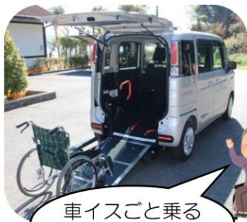
車イスごと乗ることが出来ます

この度、全国で展開されている「ふるさと納税制度」で、本町の社会福祉協議会支援を選択された「ふるさと納税交付金」と、皆様からの社協会費や寄付金を活用して、「外出支援サービス事業」で使用する車イス送迎車(スズキ スペース)を購入させていただきました。