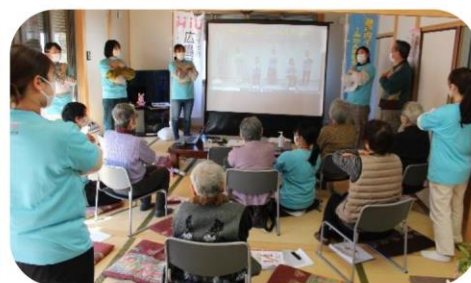
「わらって生きよう」をみんなで踊りました！

サロンの皆さんに温かく迎えられ、学生にとって貴重で楽しい時間を過ごすことができました。サロンの皆さんもコロナ禍の前を思い出し、懐かしい気持ちと若い世代からの元気ももらい、「また来年元気にサロンで再会しよう」という新たな目標を掲げることができ、今回の交流が皆さんの生きがいにつながりました。来年が待ち遠しいですね！