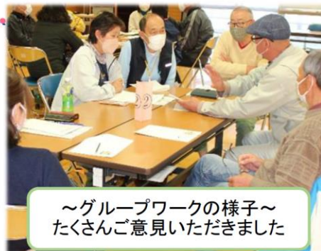
～グループワークの様子～ たくさんご意見いただきました

いただいたご意見を取り入れながら、協力員の皆様と一緒に、もっと快適にご利用いただける外出支援サービスにしていきます。