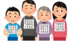
行政職員の説明に興味津々