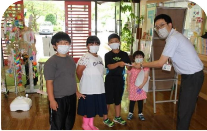
社協本所において、リーフレットをいただきました

以前ご紹介した木江小学校3年生のふくし出前講座で児童が学んだことをまとめたリーフレットを持って来てくれました。