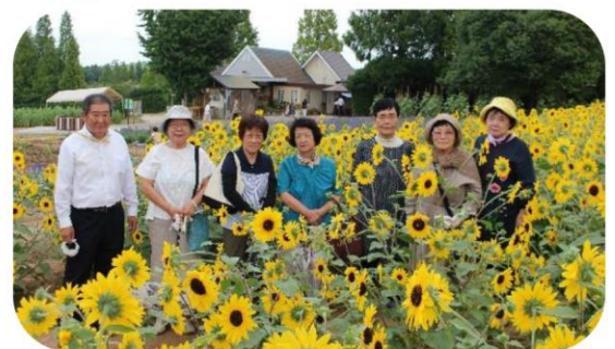
世羅高原農場で記念写真

介護についての思いや悩みを一人で抱えこまず、ぜひ一度家族会へ来てみませんか？お待ちしております。 社協居宅介護支援事業所 ☎62-1255（担当：泉）