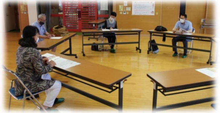
推進委員と担当者とで議論を深めました

推進委員会を通して、活動を必要としている人と、活動したい人がつながるサービスにしていくために、本会として今後の活動や広報、研修会など、今まで以上に工夫してまいります。