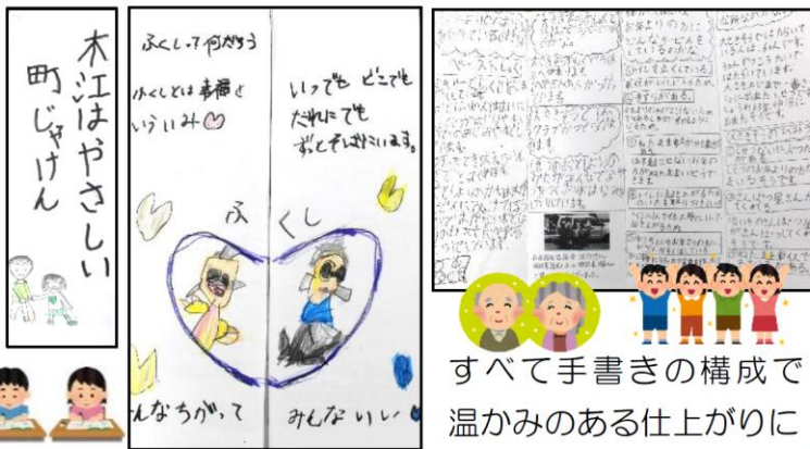
すべて手書きの構成で温かみのある仕上がりに