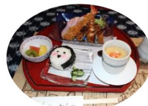
そば処わらべにて皆で食卓