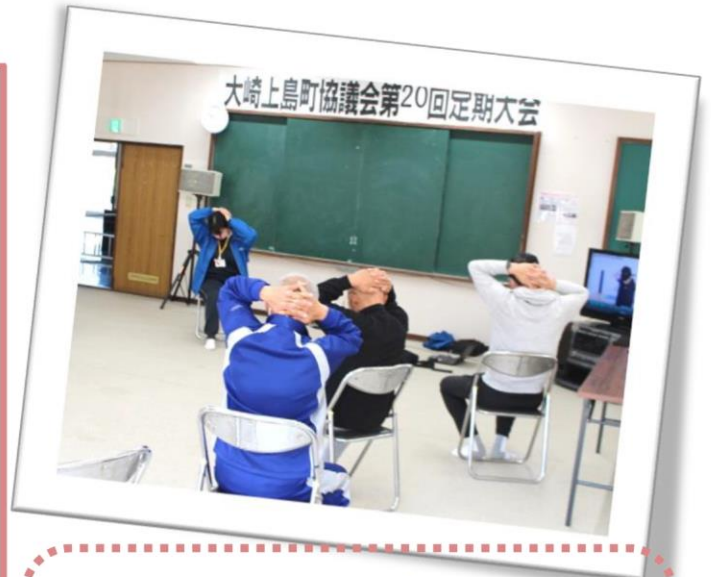
肩甲骨周辺の筋肉の状態をチェック！

肩甲骨周辺の筋肉を柔らかくすることにより、肩こりや血行不良の改善につながることをお伝えしました。