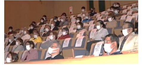
会場の席数も通常の半分以下に