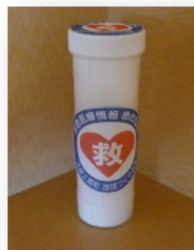
命の宝箱 (救急医療情報キット)

連絡先や主治医、内服薬の変更などあった場合に、古い情報のままだと万が一の時、間違った情報を提供してしまうことになります。年度の変り目にぜひ確認をお願いします。「詳しい説明が聞きたい」「用紙がほしい」等ご要望がありましたら、 社協本所（☎62-1718） へお願い致します。