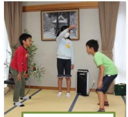
ジャスチャーゲーム