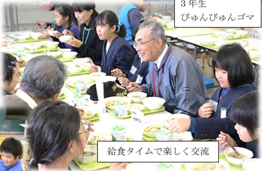
給食タイムで楽しく交流