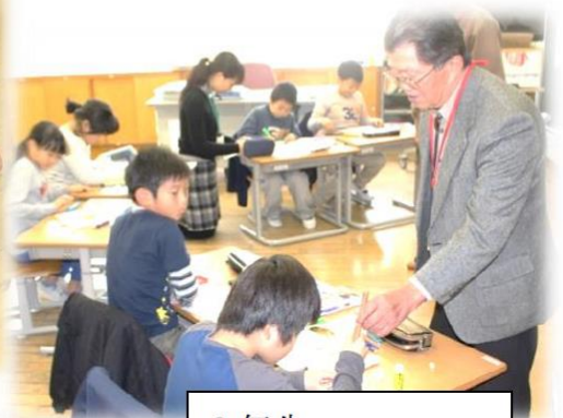
3年生 びゅんびゅんゴマ