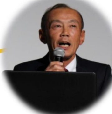
本郷区 区長 島瀬 弘文様