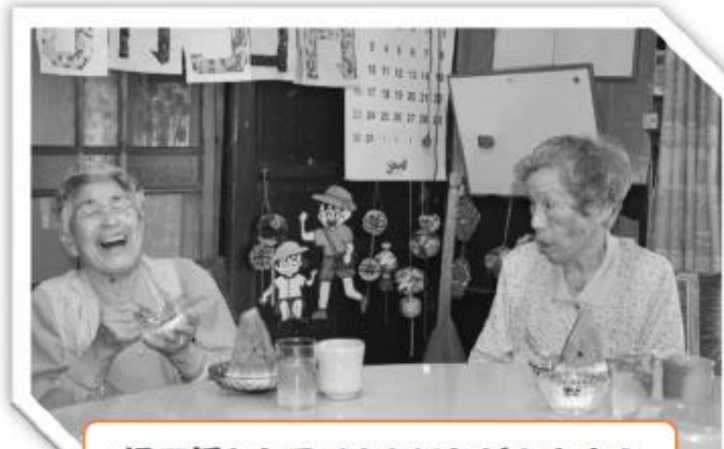
畑で採れたスイカをいただきます！