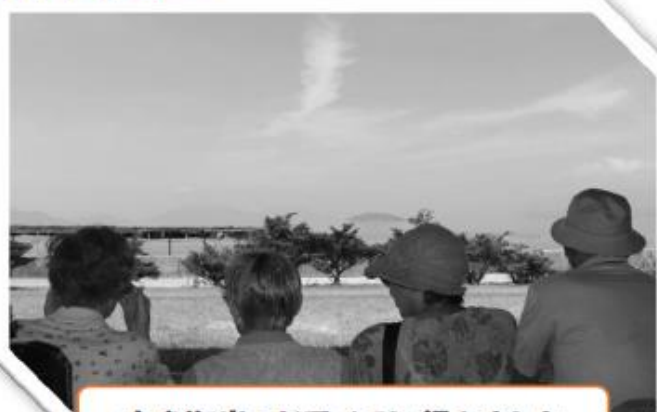
大串海岸へドライブに行きました