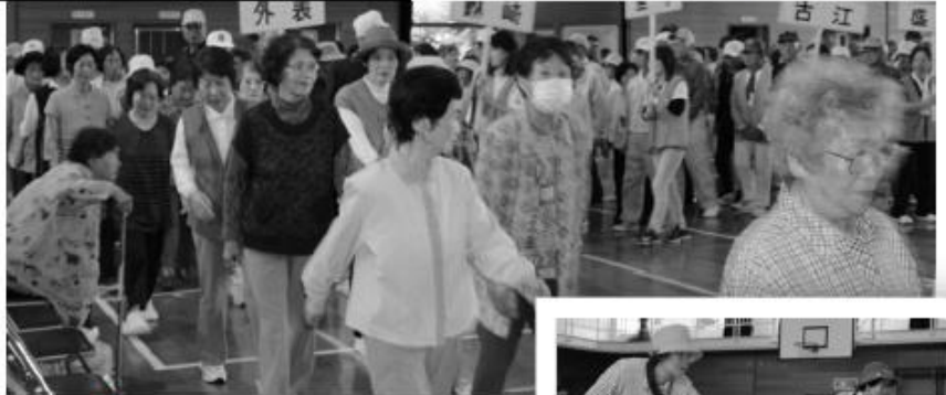
6月6日 東野・木江地区

6月6日(土)東野屋内運動場で東野・木江地区老人クラブ(総勢230名)が、6月20日(土)大崎小学校体育館で大崎地区老人クラブ(総勢370名)が集まり、スポーツ大会を開催しました。