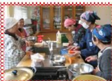
栄養バランスもとりましょう！