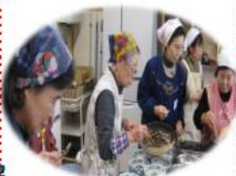
みんなで楽しく調理実習