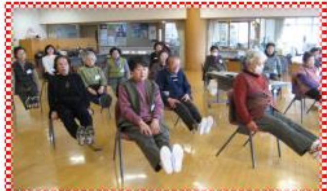
いつまでも自分の足で歩けるように筋力アップ