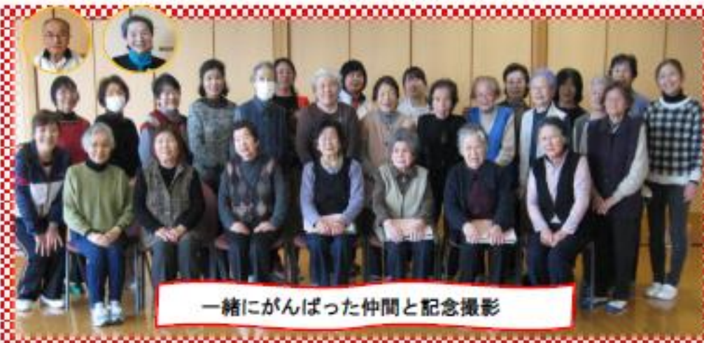
一緒にがんばった仲間と記念撮影

15回という参加回数は長く感じられていたようですが、最終回が近くなるにつれ、「名残惜しいね」という声も聞こえてきました。