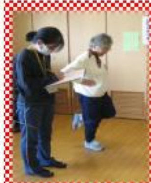
初回と最終回の体力測定で体力の変化を比べます。