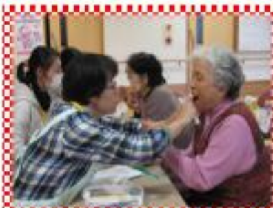
歯科衛生士さんによる口腔チェックと指導を受けます