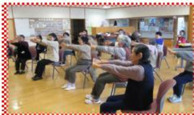
作業療法士の先生の指導で個人にあった運動指導