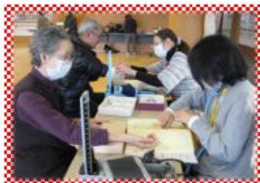
毎回、看護師さんによる健康チェック