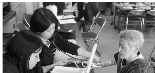
活動発表: 広島国際大学 ボランティアグループ