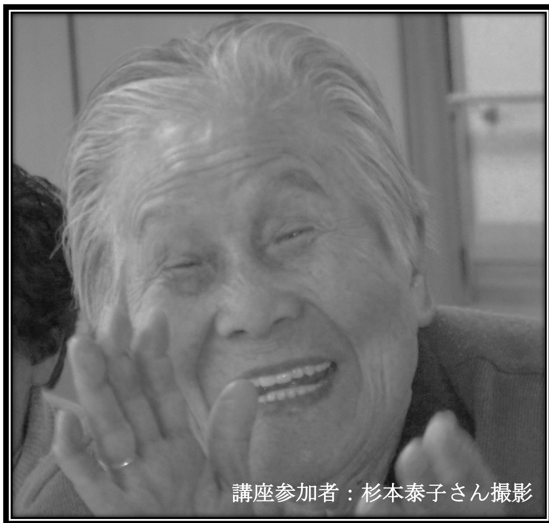
講座参加者：杉本泰子さん撮影