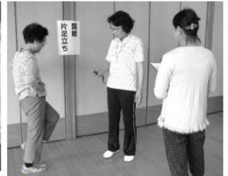
まずは体力測定で体力をチェック