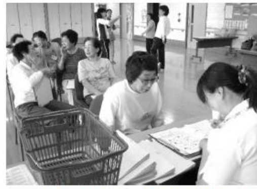
作業療法士さんから運動の個人指導を受けます。