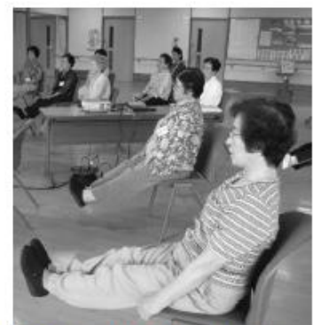
手足の筋力運動を中心に全員で体操を行います。