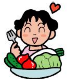
みんなで分担して調理実習。みなさん手際が良く、あっという間に美味しいご飯の出来上がり。