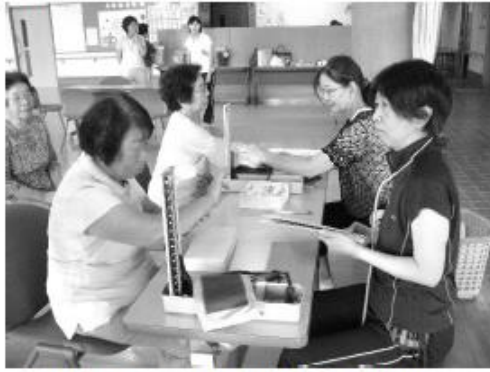
看護師さんによる健康チェック