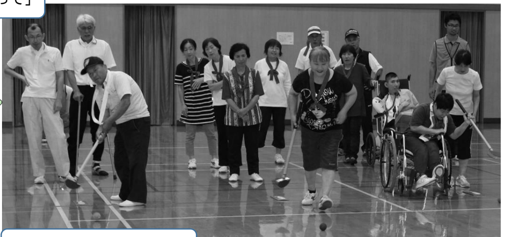
※ホールインワンゴルフ※