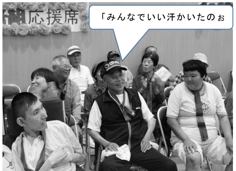
「みんなでいい汗かいたのお」

広島市北部を中心としたこのたびの大雨により被害を受けられた皆様に、謹んでお見舞い申し上げます。亡くなられた方々に衷心よりお悔み申し上げますとともに一日も早い復旧を心よりお祈り申し上げます。