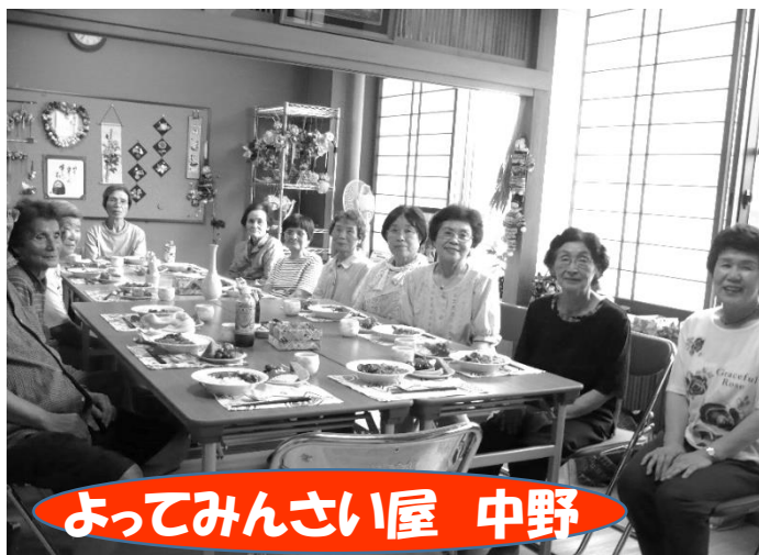
よってみんない屋 中野

このように、サークル活動、仲良しグループのお茶会、打ち合わせなど使い方はいろいろ出来ます！