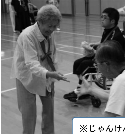
※じゃんけんリレー競争※

7月21日(月)ふれあいホール大崎(中電ホール)で、身体障害者福祉協議会、わかばの会、来賓、スタッフの総勢85名が集まりスポーツを通じて親睦を図りました。