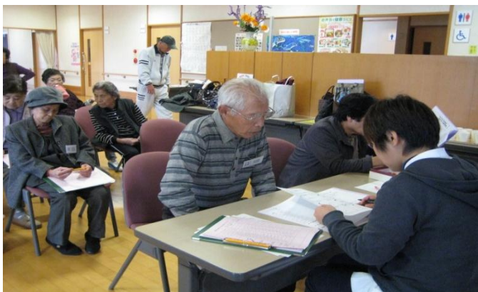
作業療法士による個別指導で、個人の状態に合った自宅で出来る運動の指導を受けます。