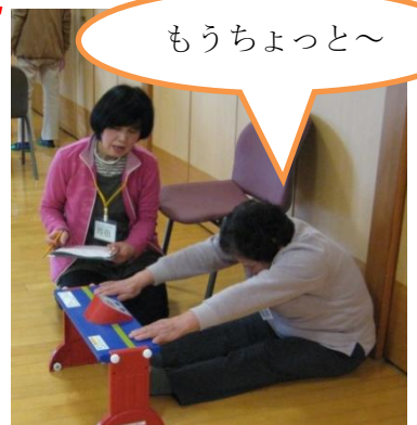
教室開始時（11月）と修了時（3月）に体力測定。運動の成果が出ています。