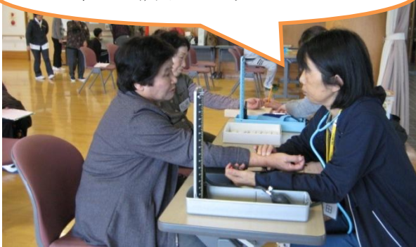
看護師による血圧測定・体調チェックで安心して運動できます。