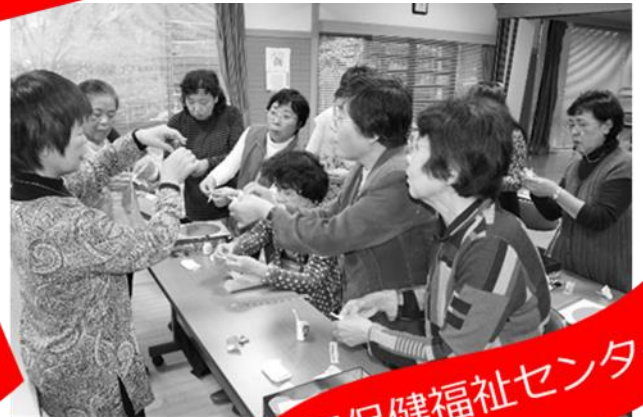
木江保健福祉センター