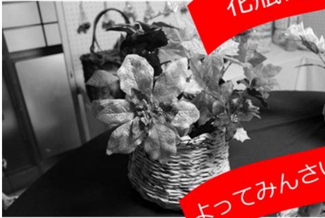
よってみんなさい屋 大串

修学旅行生も一緒に話をしながら ポスターなど作品づくりに協力。 サロンなどで島の人とふれあい ながら楽しい時間を過ごしまし た！