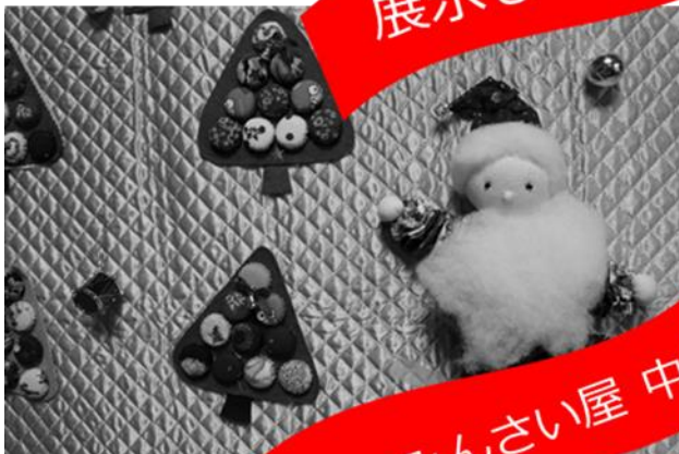
よってみんなさい屋 中野