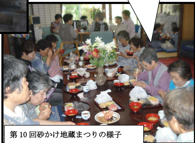
第10回砂かけ地蔵まつりの様子

「話がごちそう」をモットーに お互いさまの心で地域福祉をめざしゆっくりゆるやかに楽しく 続けていきたいと思ひます。