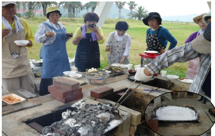
～たっぷりの塩で魚を蒸し焼く「塩釜ドーム」～