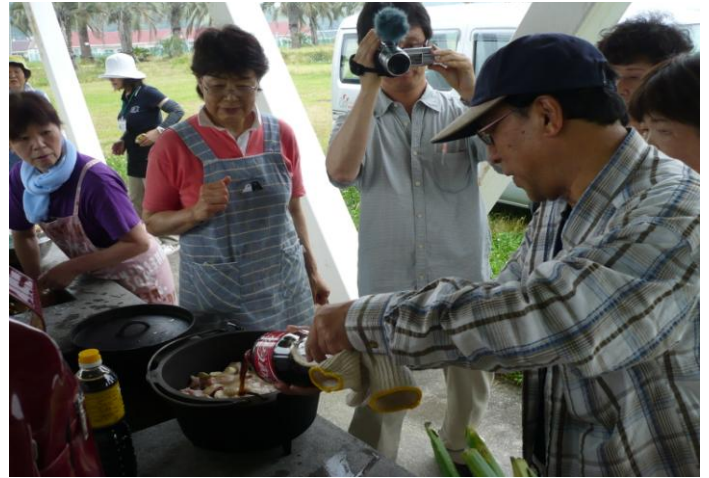
～ダッチオーブンで鶏肉のコーラ煮作り～