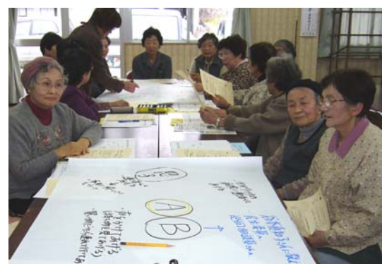
認知症学習会（サロン）