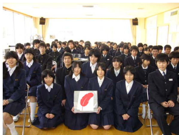
赤い羽根募金活動