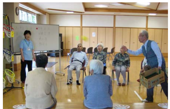
生きがいデイサービス