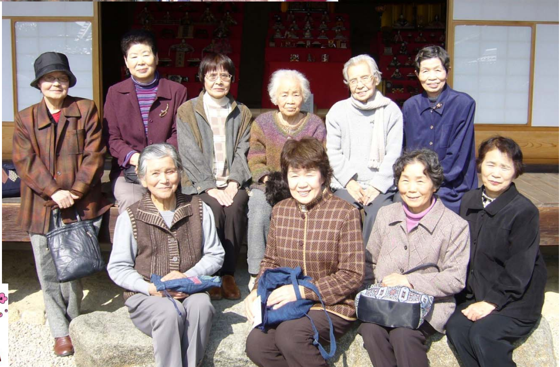
よってみんさいや中野の皆さん