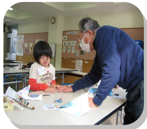
3年生 紙ひこうき作り