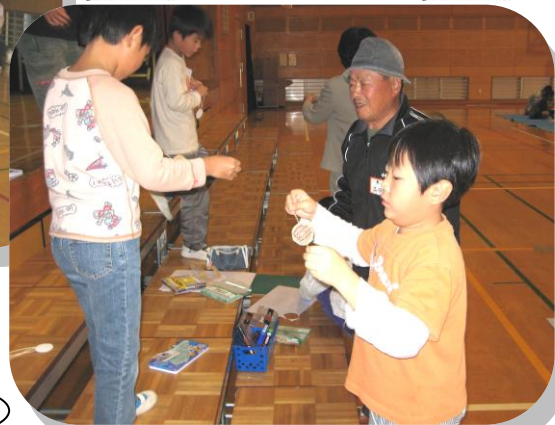
2年生 びゅんびゅんごま遊び