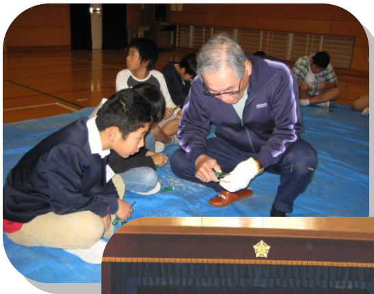
6年生 竹とんぼ作り