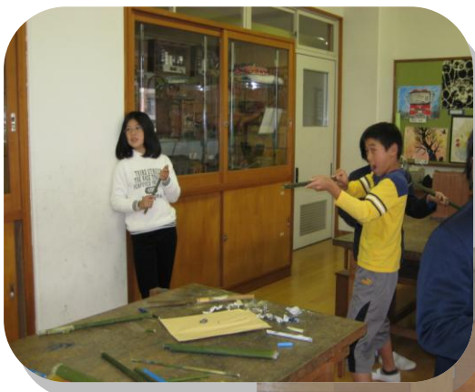
5年生 竹でっぼう遊び

昔の遊び道具作りを教えていただきながら、一緒に遊ぶ楽しさも味わいました。高齢者の方も「来てよかった！」と、ふれ合いを通して子どもとの結びつきを深めました。