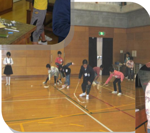
4年生 ぶちごま遊び